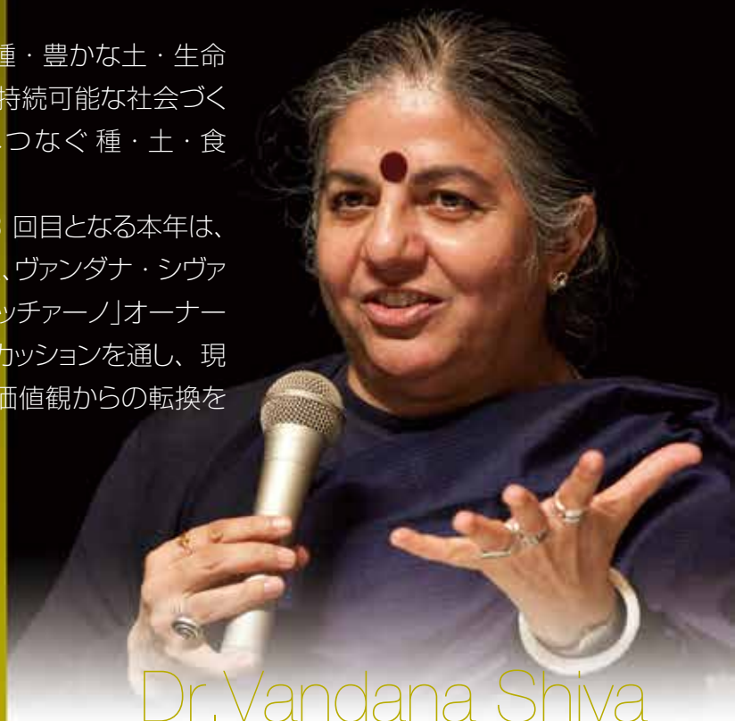
Dr. Vandana Shiva

○お申込み・お問い合わせ NPO法人 秀明インターナショナル TEL : 0748-82-3140 URL : www.nposhumei.or.jp E-MAIL : nposhumei@shumei.or.jp