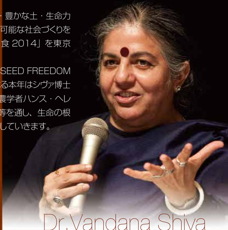
Dr. Vandana Shiva

NPO法人 秀明インターナショナル TEL : 0748-82-3140 URL : www.nposhumei.or.jp E-MAIL : nposhumei@shumei.or.jp